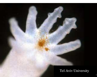
Tel Aviv University