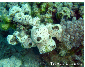
Tel Aviv University