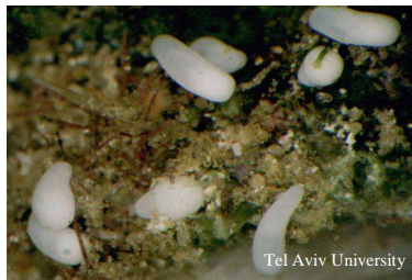
Tel Aviv University